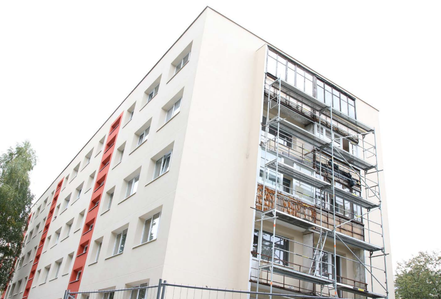
Apšiltinti daugiabučiai namai suvartoja mažais šilumos, todėl jų gyventojų mokėjimai už šildymą yra maži

2012 m. Europos Parlamentas priėmė 2012/27/ES Energijos vartojimo efektyvumo direktyvą. Jos vienas iš tikslų – įpareigoti valstybes nares energetikos sektoriuje įdiegti energijos vartojimo efektyvumą didinančias priemones, padedančias užtikrinti maksimaliai efektyvų išgautos energijos panaudojimą. Direktyvoje taip pat kalbama apie šilumos apskaitos butuose įrengimą bei teisingą sąskaitų už šilumą išrašymą.