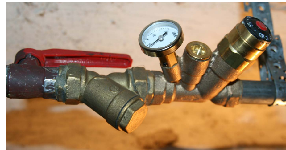
Vidaus karšto vandens sistemoje atlikti darbai