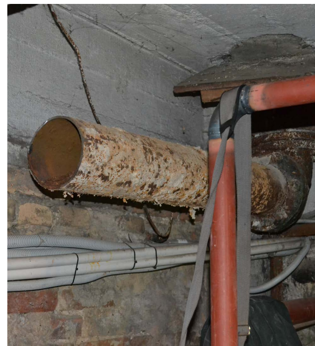
Senamiesčio daugiabučiuose vidaus šildymo sistemos buvo natūralios cirkuliacijos, todėl dabar vamzdinių skersmenys yra per dideli

Kitų pasaulio miestų praktika rodo, kad taip galima sutaupyti 20–30 % energijos.