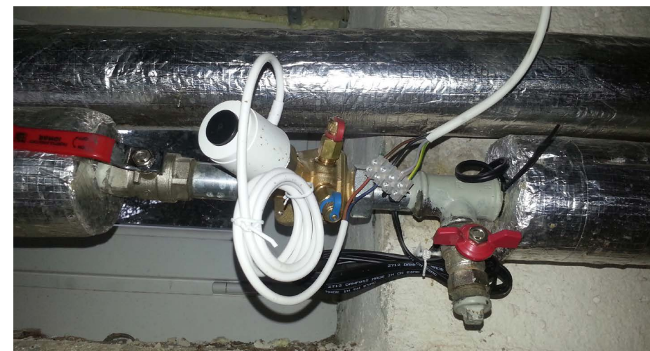
Vidaus šildymo sistemos balansavimo įranga su automatika