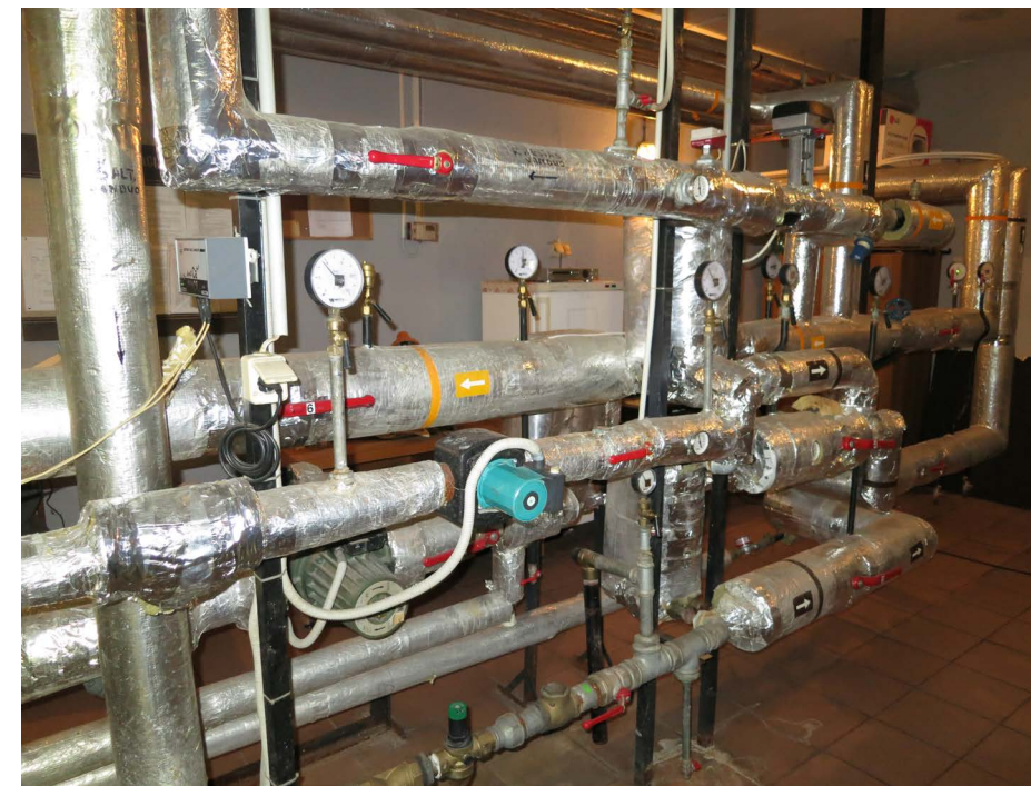
Automatizuoti šilumos punktai leidžia gyventojams taupyti šilumą